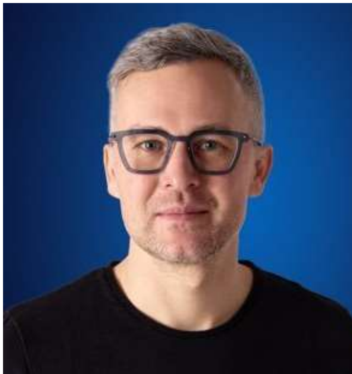
Ondřej Krutílek, europoslanec, člen Výboru pro průmysl, výzkum a energetiku EP

Aktuálně (30. 10. 2024) k ELEKTROMOBILITĚ: