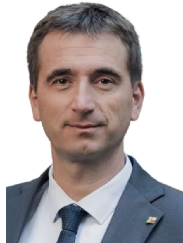
Lukáš Vlček, ministr průmyslu a obchodu